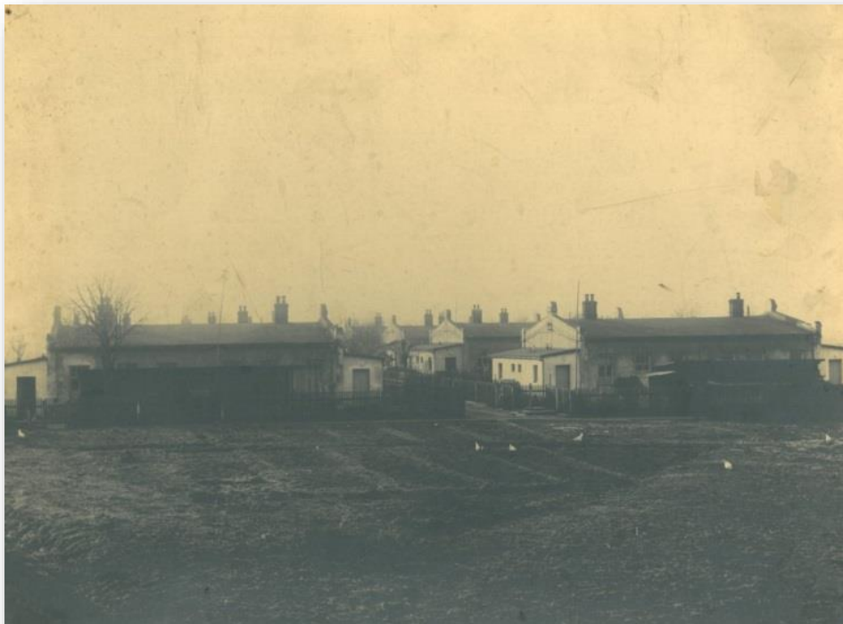
Obrázek č. 2: Historický pohled na Dělnické domky

poradenství Praha 5, do praxe byl zaveden ve školním roce 2016/2017. Jde o kontinuální program zaměřený na výchovu ke zdravému životnímu stylu a rozvoj pozitivního sociálního chování, na vzdělávání pedagogických pracovníků v oblastech diagnostiky a řešení krizového chování, akceptuje významnou roli rodičů a široké rodiny při výchově dětí, nepomíjí všeobecnou prevenci zaměřenou na širší populaci.